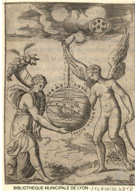
BIBLIOTHEQUE MUNICIPALE DE LYON -11680N004818