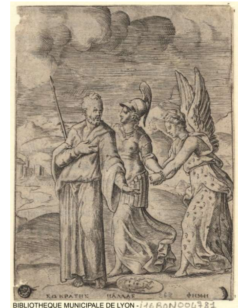
BIBLIOTHEQUE MUNICIPALE DE LYON -11680N004781

Ce colloque sera donc l'occasion de se pencher sur des phénomènes et des notions (notamment celles de crédit et d'honneur) inscrites dans des historiographies différentes, mais dont les usages invitent à envisager de concert. Ces mécanismes n'étant pas réductibles à la seule société française, les approches transnationales ou comparatistes seront évidemment présentées, de même que les autres disciplines (droit, sociologie, économie, littérature), afin de faire converger les réflexions.