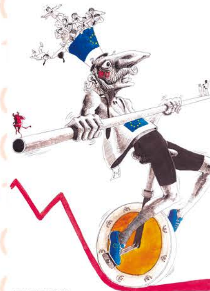
L'Europe gravit la cote à 27 contre 1 Romuald Sum